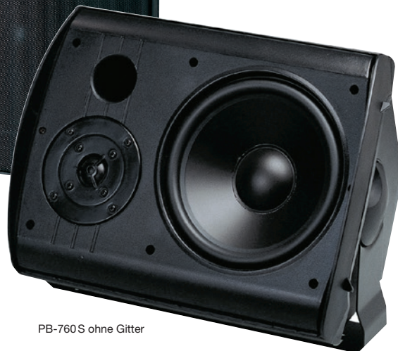
PB-760 S ohne Gitter