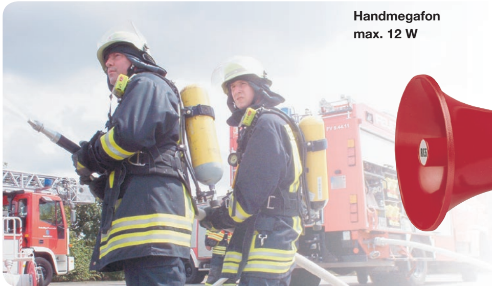
Handmegafon max. 12 W