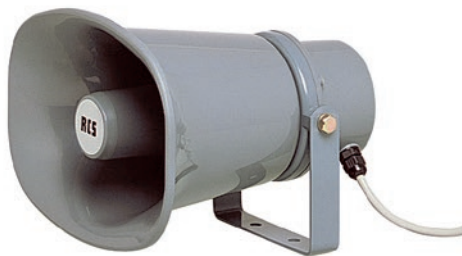
Druckkammerlautsprecher, mit 100V-Übertrager. . . . . DH-115S