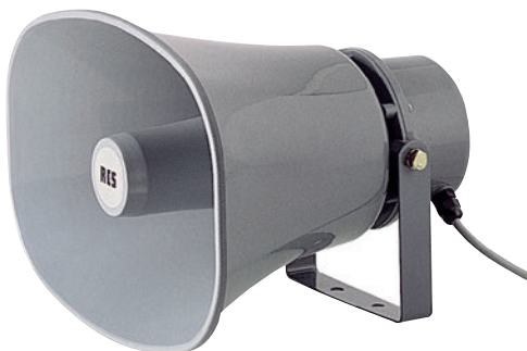
Druckkammerlautsprecher, mit 100V-Übertrager. . . . . DH-130S