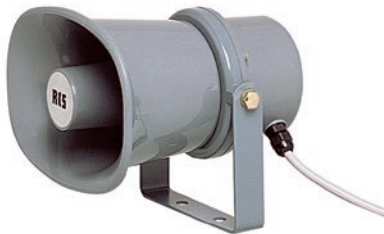
Druckkammerlautsprecher, mit 100V-Übertrager. . . . . DH-110S