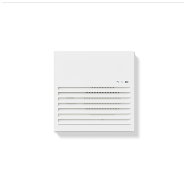
Access-Türlautsprecher für Siedle Vario ATLM 770-0 W 210011520-00