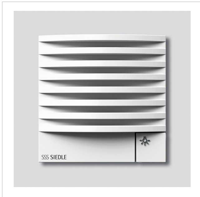
Access-Türlautsprecher-Modul Plus ATLM 671-0 W 210007344-00