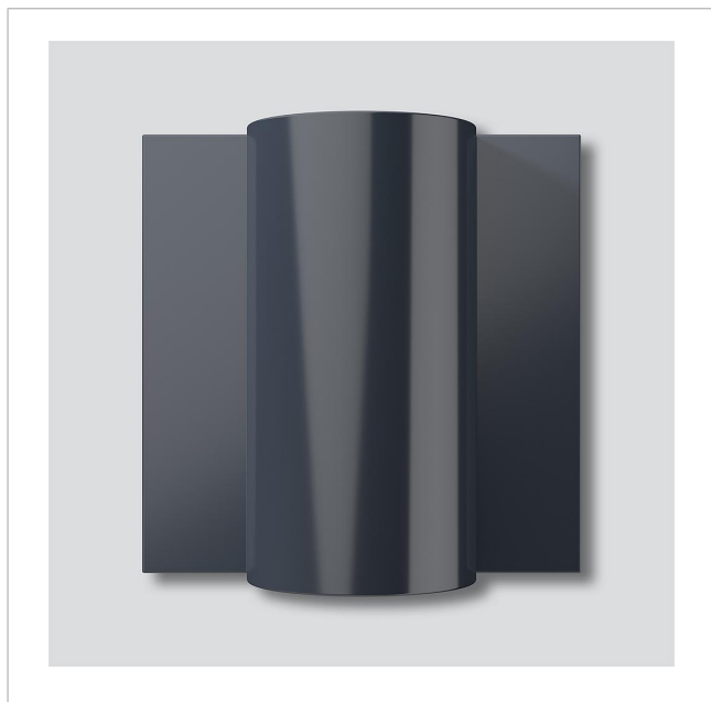
LED-Spot LEDS 600-0 AG 210004990-00