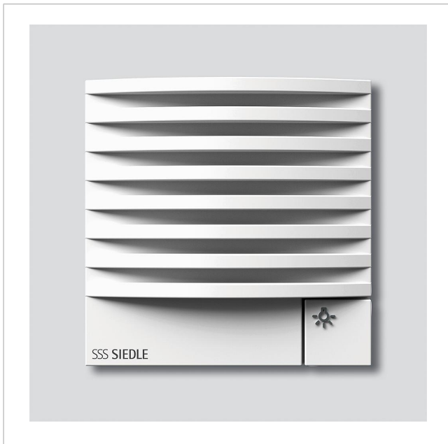
Access Türlautsprecher-Modul ATLM 670-0 W 200041755-00