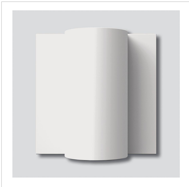
LED-Spot LEDS 600-0 W 200036615-00