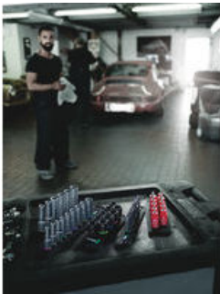
Die Wera Belts