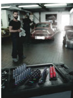
Die Wera Belts