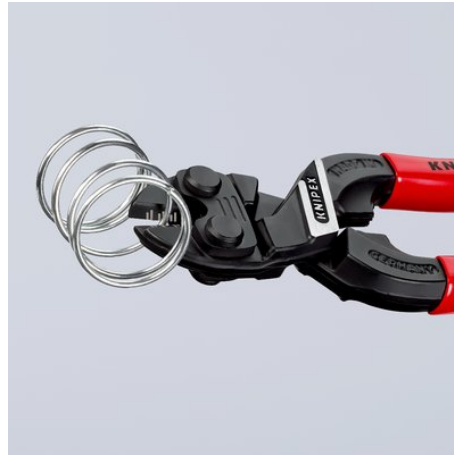
Leistungsstark bis in die Spitzen