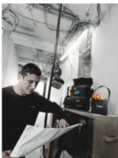
Wera 2go 4 Köcher