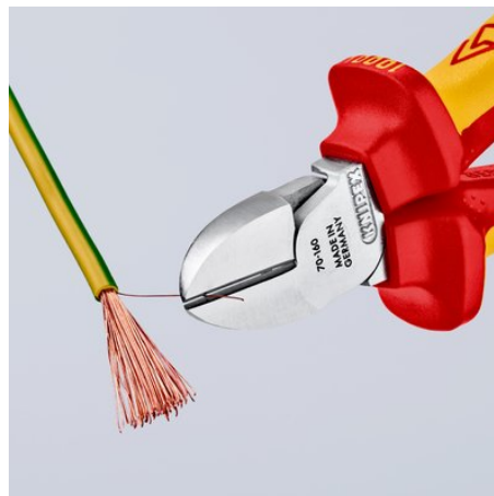
sauberer Schnitt bei dünnen Cu-Drähten, auch an den Schneidenspitzen