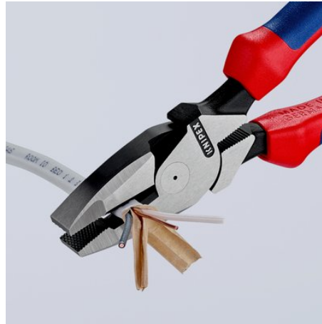
Lange Schneiden zum Trennen von flachen Kabeln