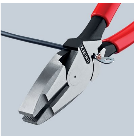
09 11/12 240: Universelle Dorn-Crimpstelle unterhalb des Gelenks