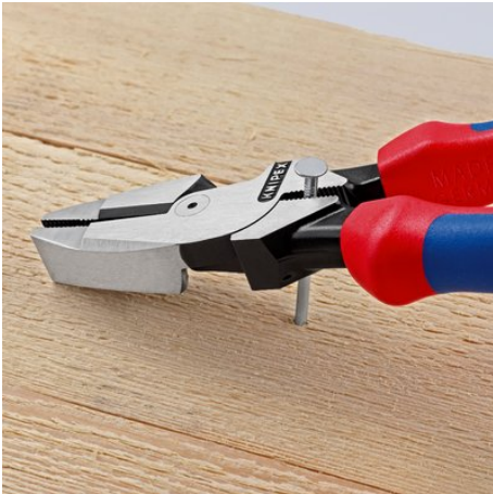
Greifzone unterhalb des Gelenks für kraftvolles Hebeln