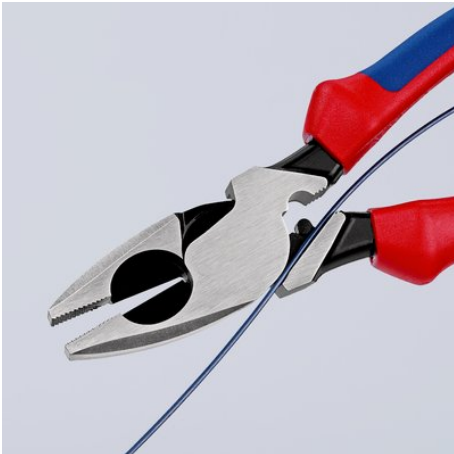
09 11/12 240: Kabel-Einziehhilfe im Gelenkspalt