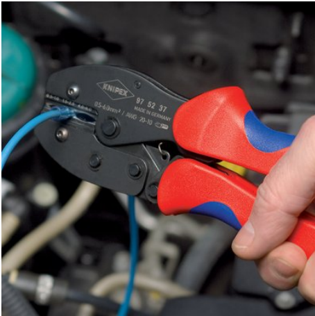
97 52 37