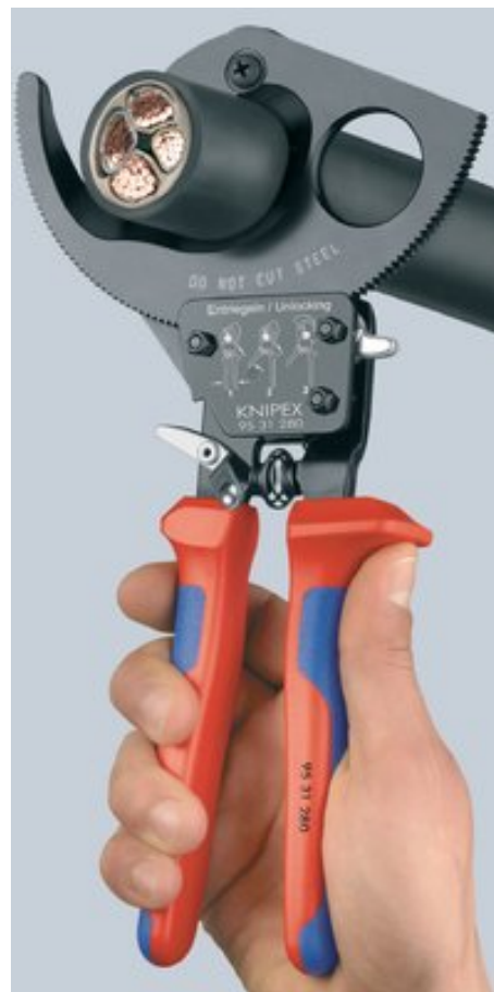
Ratschenprinzip und Zweigang-Zahnkranztrieb für kraftsparendes Schneiden