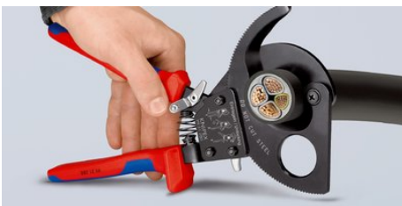
95 31 250/280: Festschenkel-Hülle mit Standfläche zum Auflegen beim Schneiden

Technische Änderungen und Irrtümer vorbehalten