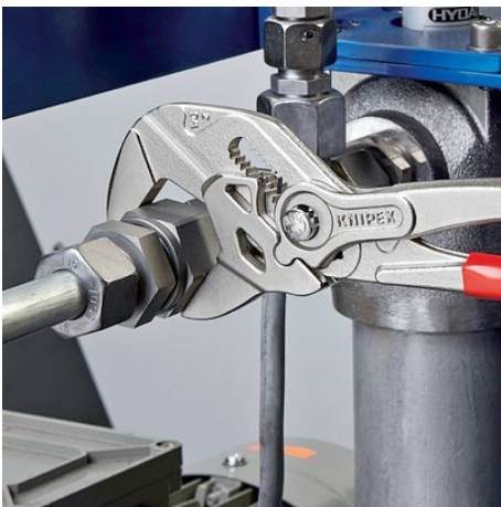
ersetzt einen Satz Schraubenschlüssel, metrisch wie zöllig