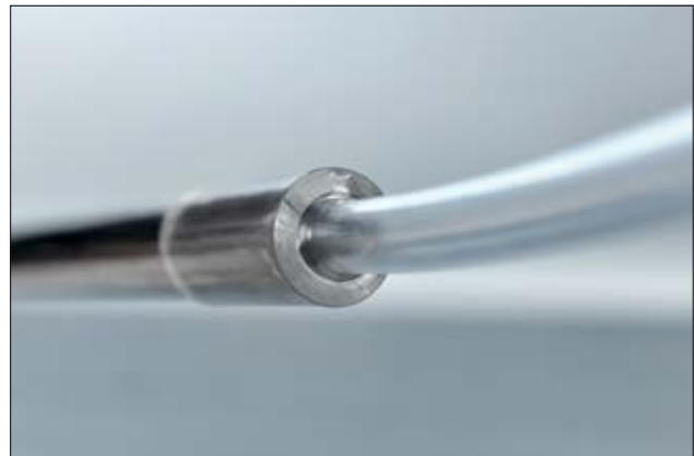
TF24 – transparenter Schrumpfschlauch mit einer Schrumpfrate von 2:1.